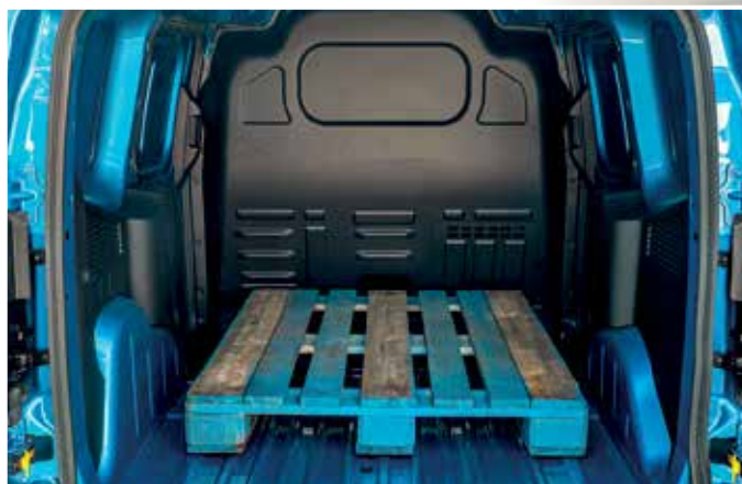
ΑΡΙΣΤΕΡΑ: Το ανακλινόμενο κάθισμα του συνοδηγού αφήνει χώρο για μεταφορά μακρύτερων αντικειμένων, όπως είναι π.χ. μία σκάλα ή σωλήνες. ΔΕΞΙΑ: Ο χώρος φόρτωσης είναι μεγάλος και η πρόσβαση διευκολύνεται από δύο πηευρικές συρόμενες πόρτες.