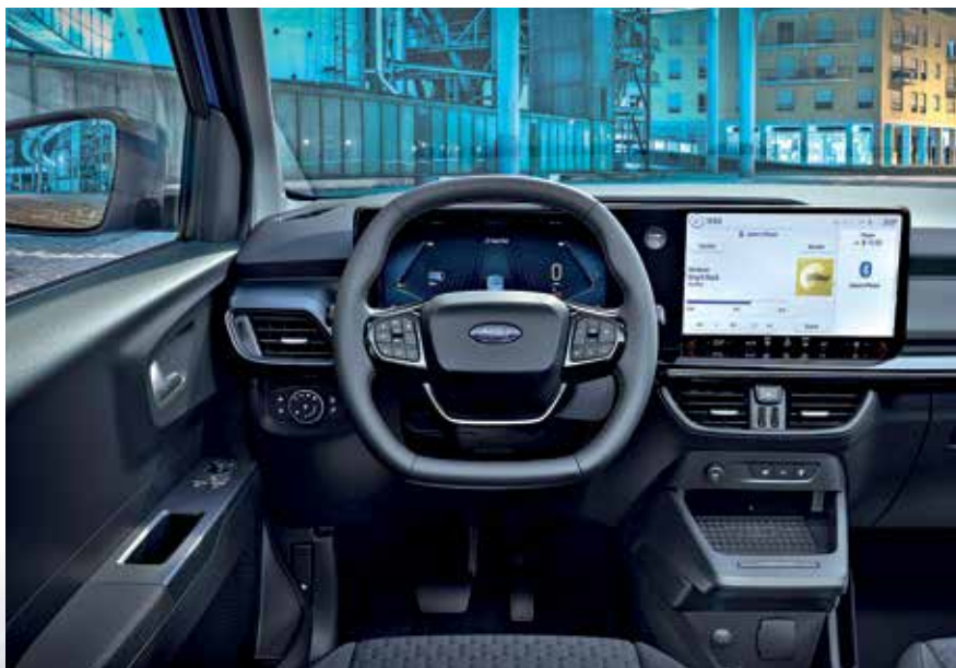
Το ταμπλό του Ford E-Transit Courier συμπληρώνεται από μια μεγάλη οθόνη αφής, για τις λειτουργίες συνδεσιμότητας και ψυχαγωγίας. Κάτω από τη μεγάλη οθόνη αφής υπάρχει θήκη ασύρματης φόρτισης κινητού τηλεφώνου.

Η επιλογή αναβάθμισης με ταχύτερο μόντεμ 5G επιτρέπει όχι μόνο τη μόνιμη