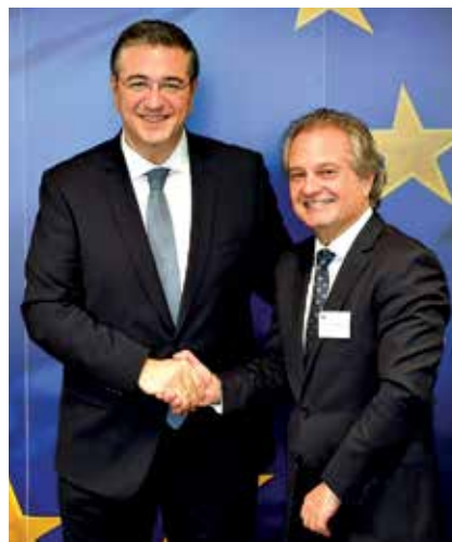
Ο κ. Χ. Σημαντώνης με τον Έλληνα Επίτροπο στην Ε.Ε. κ. Απόστολο Τζιτζικώστα.

Η πράσινη μετάβαση δεν μπορεί να στηρίζεται μόνο σε ρυθμιστικά βάρη. Το